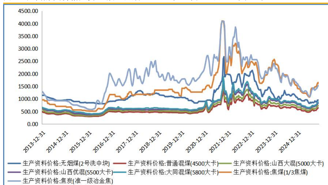
图 5：国内煤炭价格走势（截止日期：2025 年 11 月 30 日）（单位：元/吨）