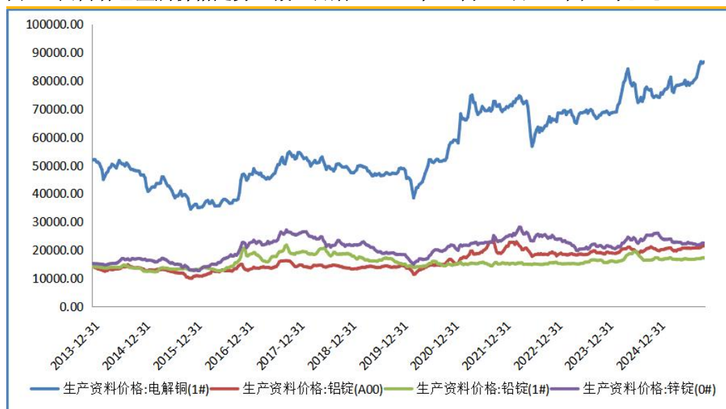
图 4：国内有色金属价格走势（截止日期：2025 年 11 月 30 日）（单位：元/吨）