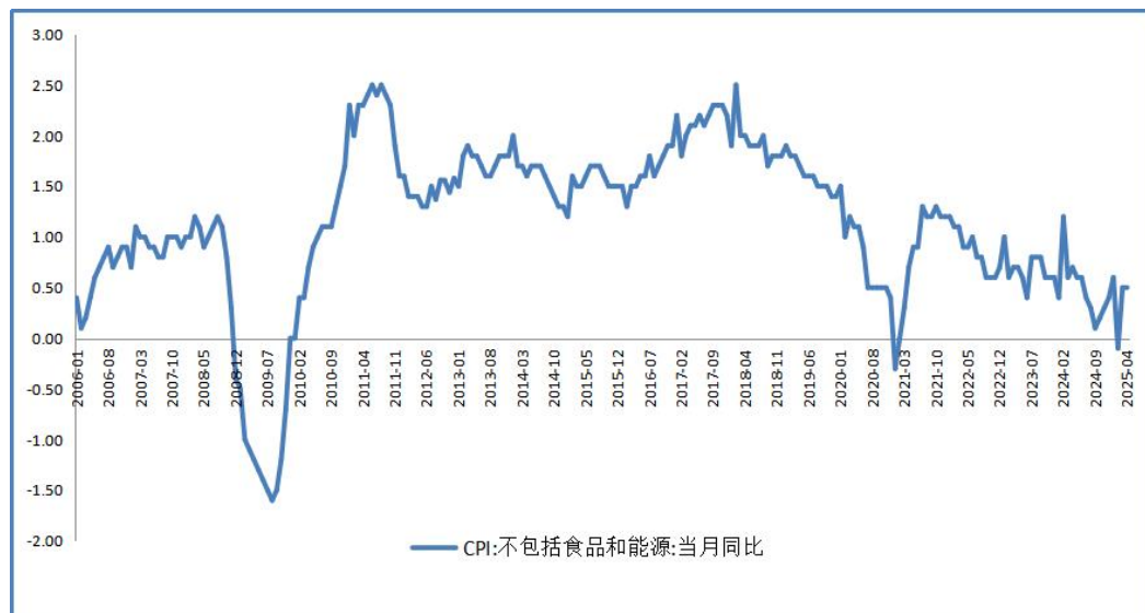
图 2：CPI:不包括食品和能源:当月同比（单位：%）