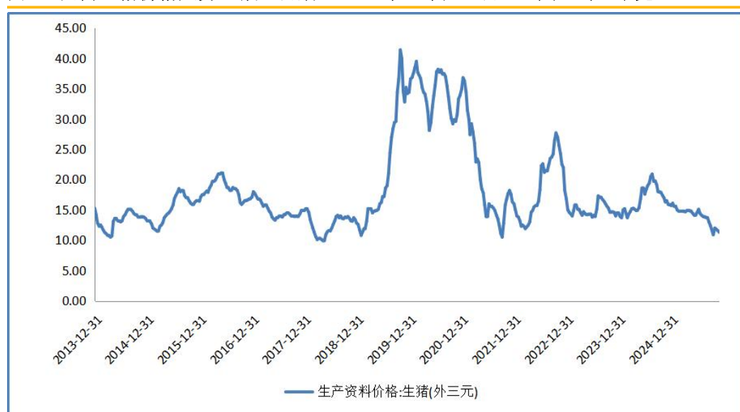
图 6：国内生猪价格走势（截止日期：2025 年 11 月 30 日）（单位：元/千克）